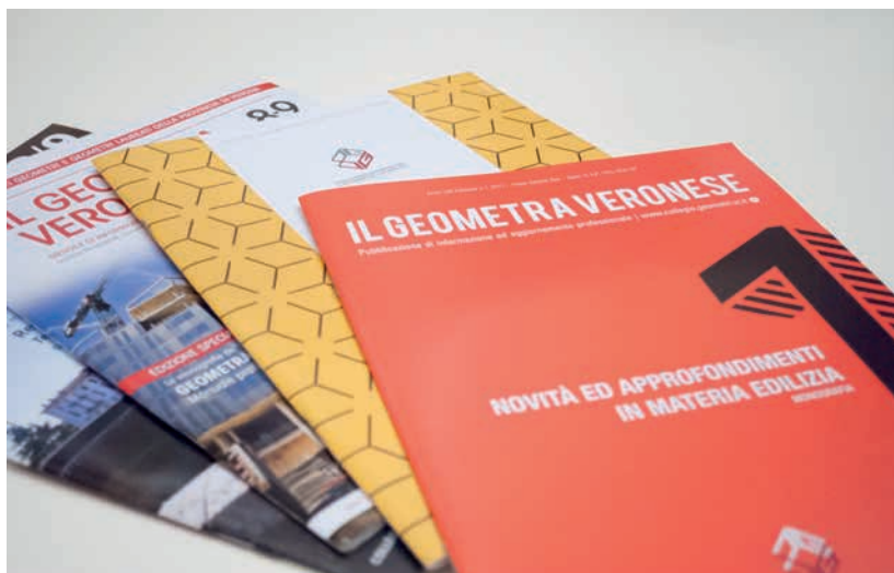
Alcune copertine delle monografie de "Il Geometra Veronese"