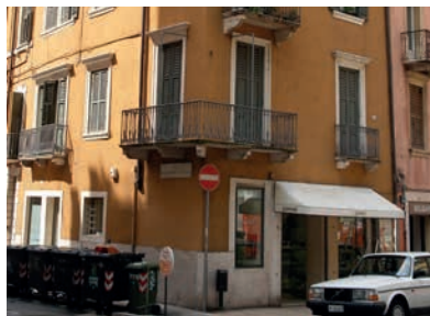
Prima sede storica dei geometri veronesi (1° piano) | Via San Salvatore Corte Regia n. 11 - Verona