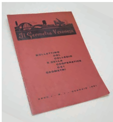
La prima edizione del gennaio 1961

nello spirito di una lunga tradizione che ha avuto sempre riscontri ampiamente positivi. Infatti, è con una punta di orgoglio che vogliamo sottolineare come la nostra rivista abbia così faticosamente acquisito una sua identità assai apprezzata anche in altri ambiti professionali e anche al di fuori della stessa provincia. Per di più è stata per molti anni una delle pochissime riviste di categoria con cadenza mensile, con conseguente costante impegno da parte della redazione: un “fiore all’occhiello” dei geometri veronesi.