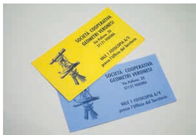
I "famosi" tagliandini per fotocopie al Catasto

una nella sezione terreni ed una in quella fabbricati del catasto, che consentissero di effettuare fotocopie di mappe e partite catastali. L'iniziativa, promossa nella primavera del 1988 , ebbe ottimi risultati, tanto da migliorare in tempi brevi la drammatica situazione che si era venuta a creare, anche a danno del comune cittadino. Il servizio di fotocopie inizialmente doveva essere gestito dalla Coo-