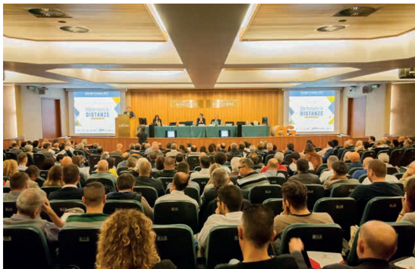
Ottobre 2017 – Un importante evento organizzato dalla Cooperativa

La Cooperativa, in tal senso, ha messo in campo un'attività molto intensa a favore dei propri soci iscritti al Collegio, anche per assolvere all'obbligo della " formazione continua professionale " che, come riportato sul vigente Regolamento, "è garanzia di qualità ed efficienza della