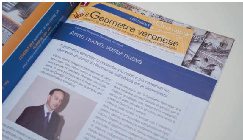
La prima edizione de 'Il Geometra Veronese' a colori

mativa; fu un cambiamento importante anche per quanto riguarda i costi di stampa che ebbero un corposo aumento. Purtroppo, la recente crisi economica nazionale ed internazionale con conseguente crollo degli introiti pubblicitari ed aumento dei costi di stampa, non hanno più consentito la sostenibilità della gestione della rivista così come da anni effettuata che vedeva l'invio a cadenza mensile de "Il Geometra Veronese" in formato cartaceo a tutti gli interlocutori.