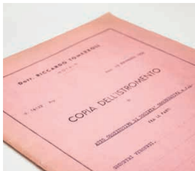
L'Atto Costitutivo del 19 Febbraio 1958