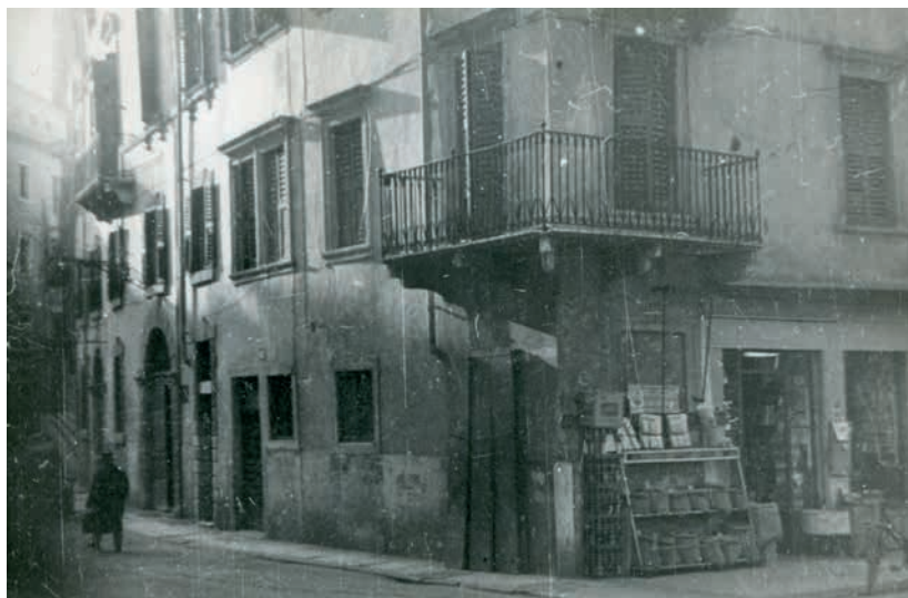
Prima sede storica dei geometri veronesi prima della ristrutturazione dell'edificio